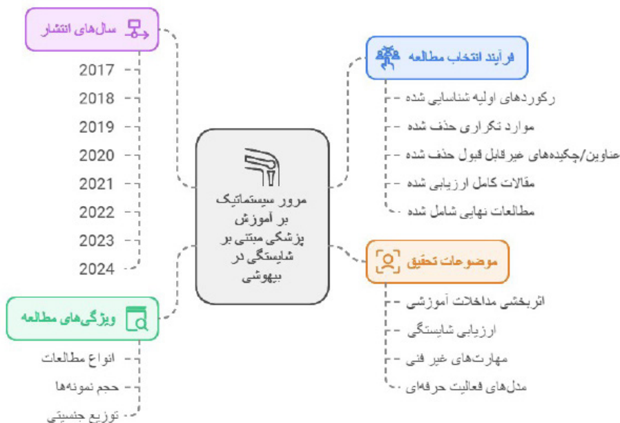
نمودار ۲: نحوه استراتژی جستجوی مقالات منتشر شده

۱۲. شواهدی مبنی بر اینکه دینفعان تحقیق در نظر گرفته شده‌اند.