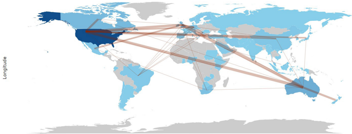
نمودار ۱: روابط بین المللی نویسندگان در نشر مطالعات

(۶۶/۷ درصد MCP)، کنیا (۱۰۰ درصد MCP)، و سوئیس (۱۰۰ درصد MCP). داده‌ها نشان می‌دهند که همکاری بین‌المللی در میان نویسندگان برخی کشورها رایج‌تر است و ایالات متحده آمریکا کمترین درصد MCP (۱۰/۹ درصد) را دارد.