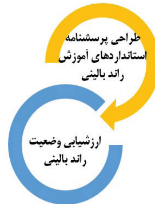
شکل ۱. مراحل اجرای مطالعه

پزشکی تایید گردید و پس از توزیع و تکمیل پرسشنامه‌ها توسط افراد مورد مطالعه (۳۰۲ نفر) پایایی آن با استفاده از شاخص همسانی درونی و ضریب آلفای کرونباخ ۰/۹۵۵ محاسبه گردید که نشان از پایایی قابل قبول پرسشنامه می‌باشد.